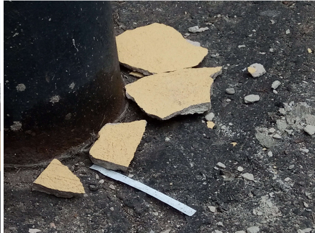
Obr. č. 11