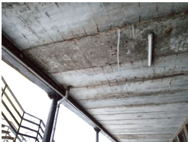
Obr. č. 7