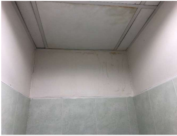
Obr. č. 13