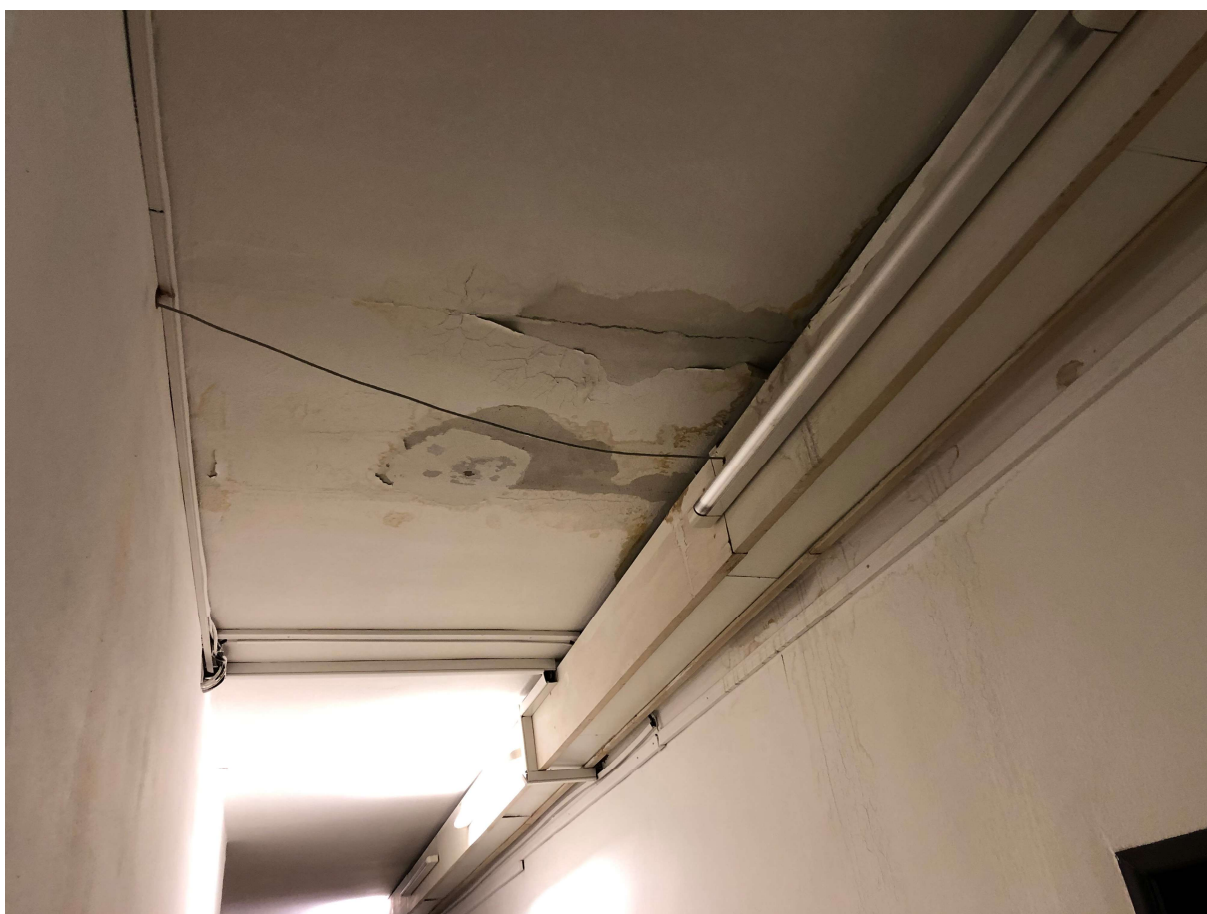
Obr. č. 9