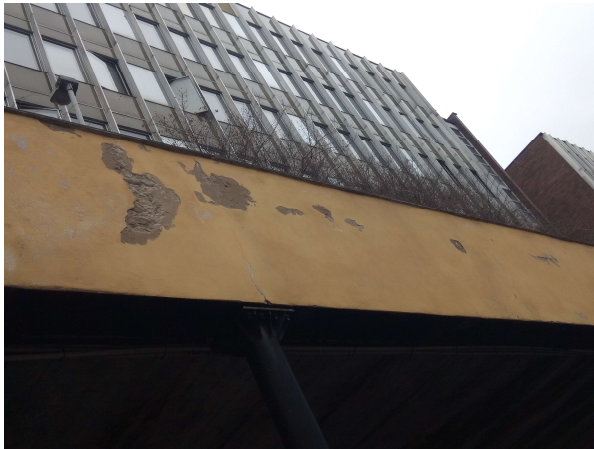
Obr. č. 10