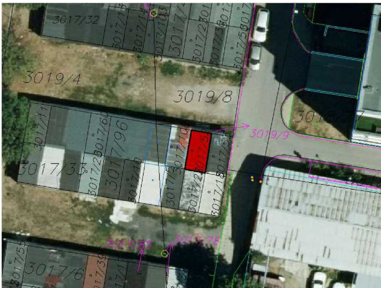
Garáž na pozemku parc. č. 3017/52 (ve správě MČ Praha 10 - zvýrazněno červenou barvou), k. ú. Michle