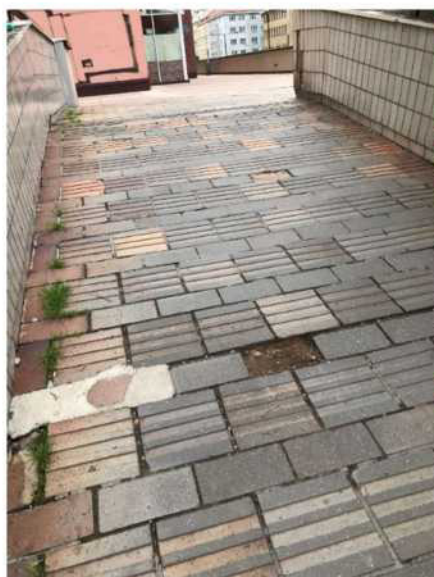
Obr. č. 7