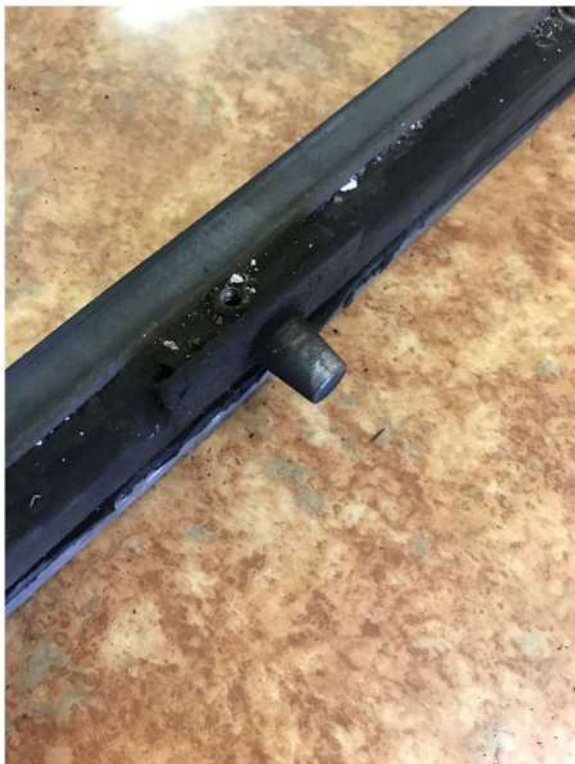
Obr. č. 9 – nepoškozený čep