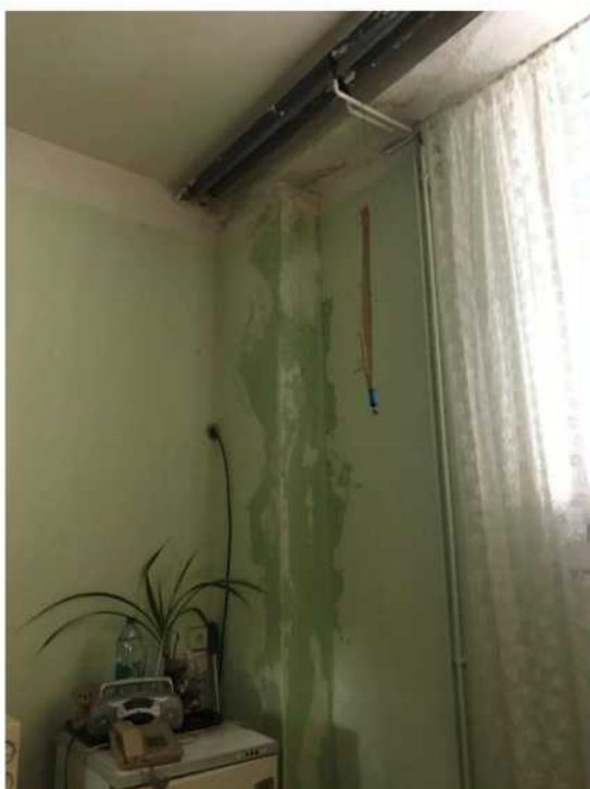
Obr. č. 11