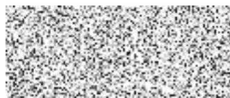
Jolana Šeřfránková předsedkyně výboru

Společenství Na Padesátém 1736 Na Padesátém 1736/4 100 00 Praha 10 IČO: 264 63 242