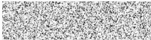
[Handwritten signature] Tomáš H r o ů i č k a

KÚR souhlasí s navrženým vymezením pozemků u celků č. 18, 34, 35, 100, 195, 211, 227, 262, 266, 283, 287, 288, 290, a 292+293 k privatizaci pozemků souvisejících s I. – XII. etapou privatizace (Privatizace do 2003) firmou SPVB a doporučuje jejich projednání v Komisi majetkové a následné schválení v RMČ a ZMČ městské části Praha 10.