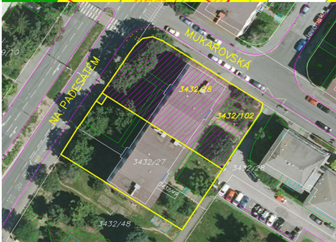
a č. 7