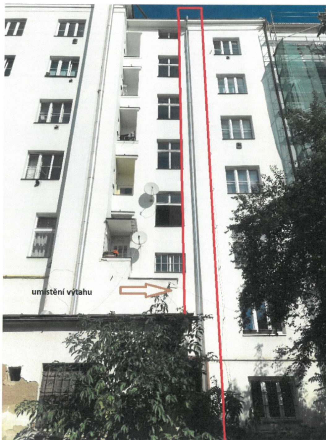
Pohled na dvorní část domu č. p. 946 s vyznačením vedení výtahového tělesa