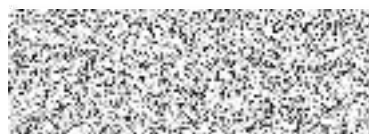
Bc. Jakub Brzon vedoucí odboru majetkoprávního